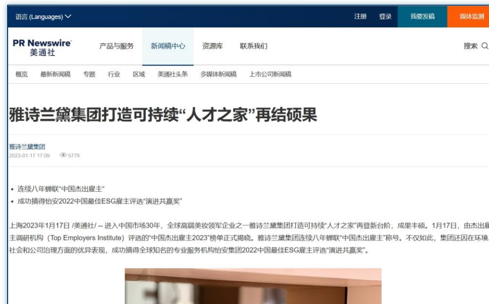
人才培养与福利 | 《雅诗兰黛集团打造可持续“人才之家”再结硕果》