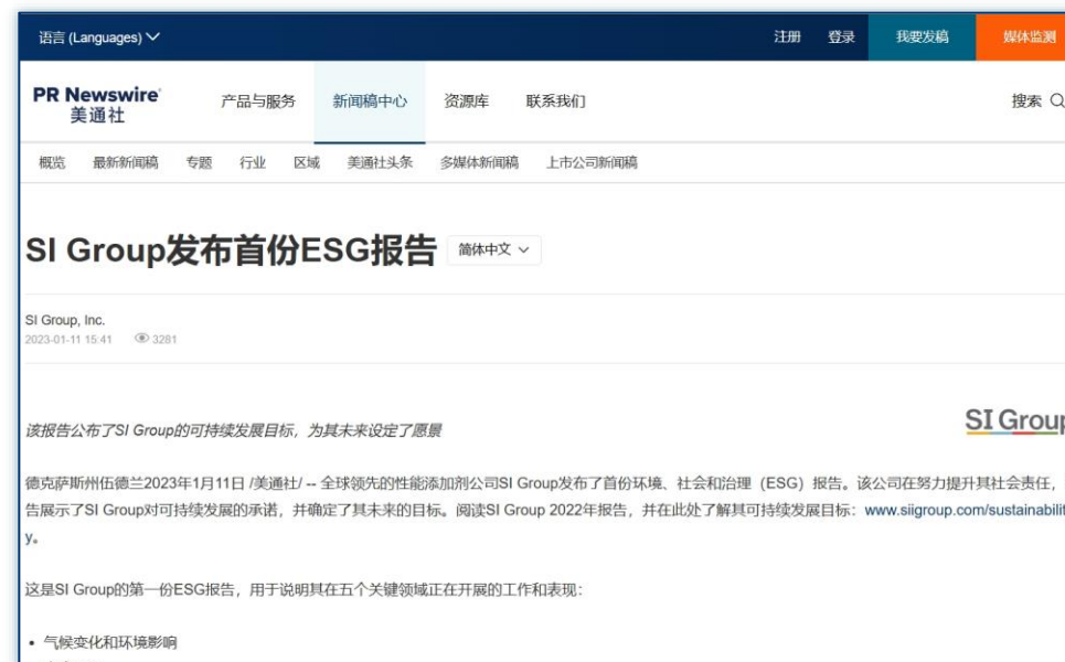
ESG进展 | 《SI Group发布首份ESG报告》