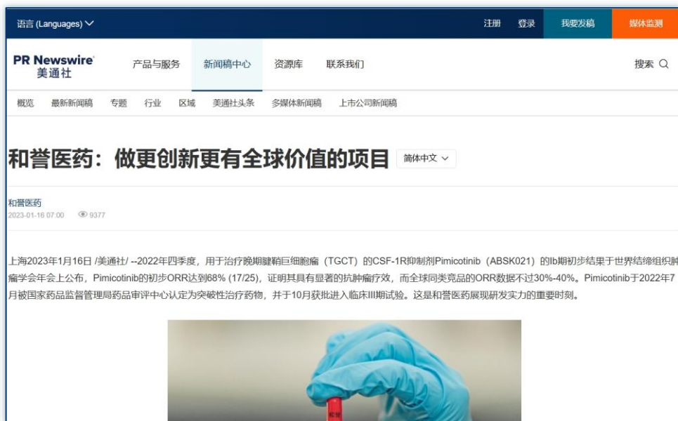
新产品或项目 | 《和誉医药：做更创新更有全球价值的项目》