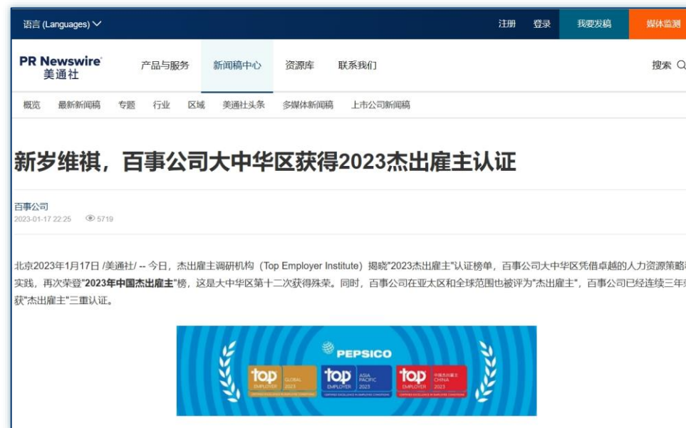
第三方背书 | 《新岁维祺，百事公司大中华区获得2023杰出雇主认证》