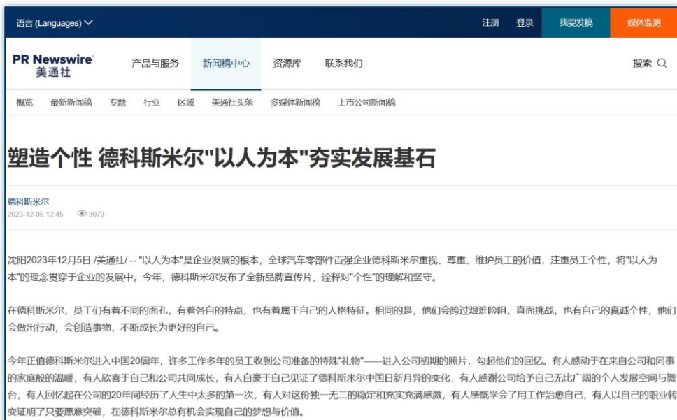
人才培养与福利 | 《塑造个性 德科斯米尔“以人为本”夯实发展基石》