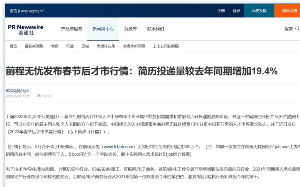
人才用工趋势 | 《前程无忧发布春节后才市行情:简历投递量较去年同期增加19.4%》