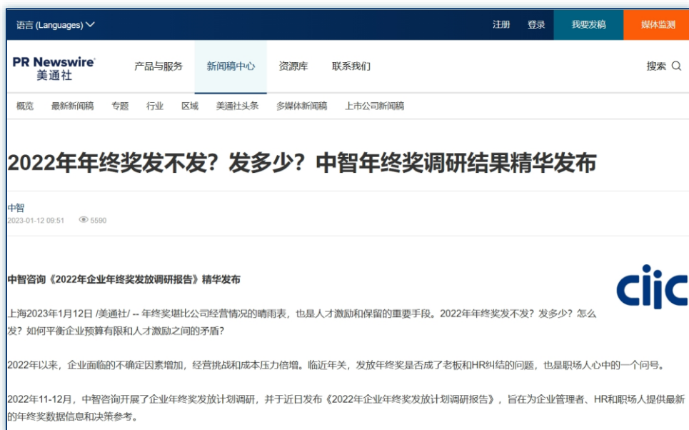
人才用工趋势 | 《2022年年终奖发不发?发多少?中智年终奖调研结果精华发布》