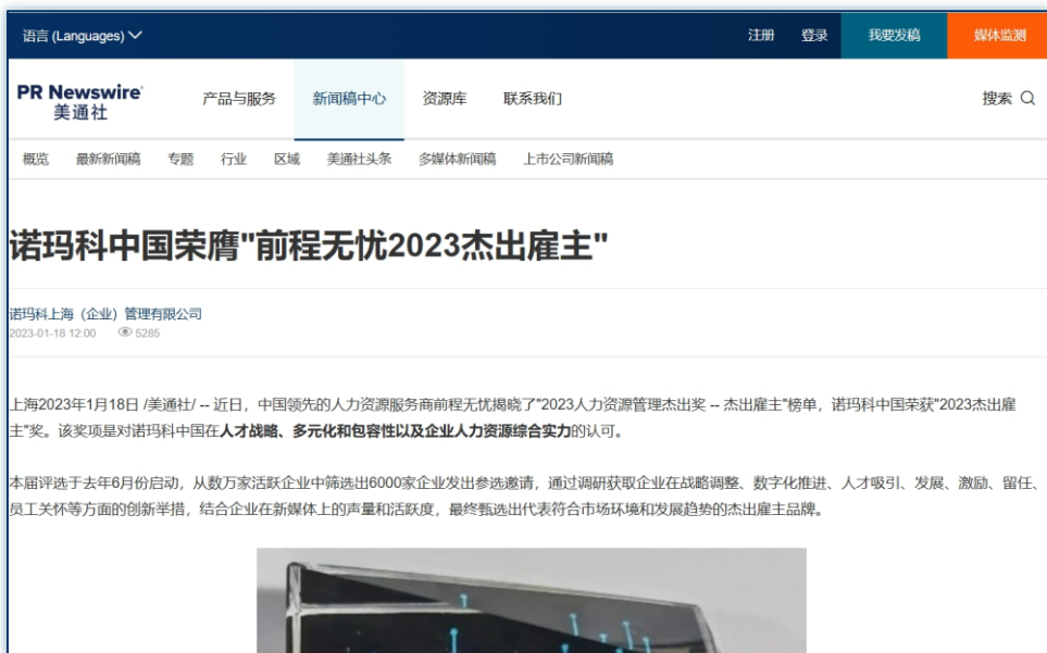
第三方背书 | 《诺玛科中国荣膺“前程无忧2023杰出雇主”》