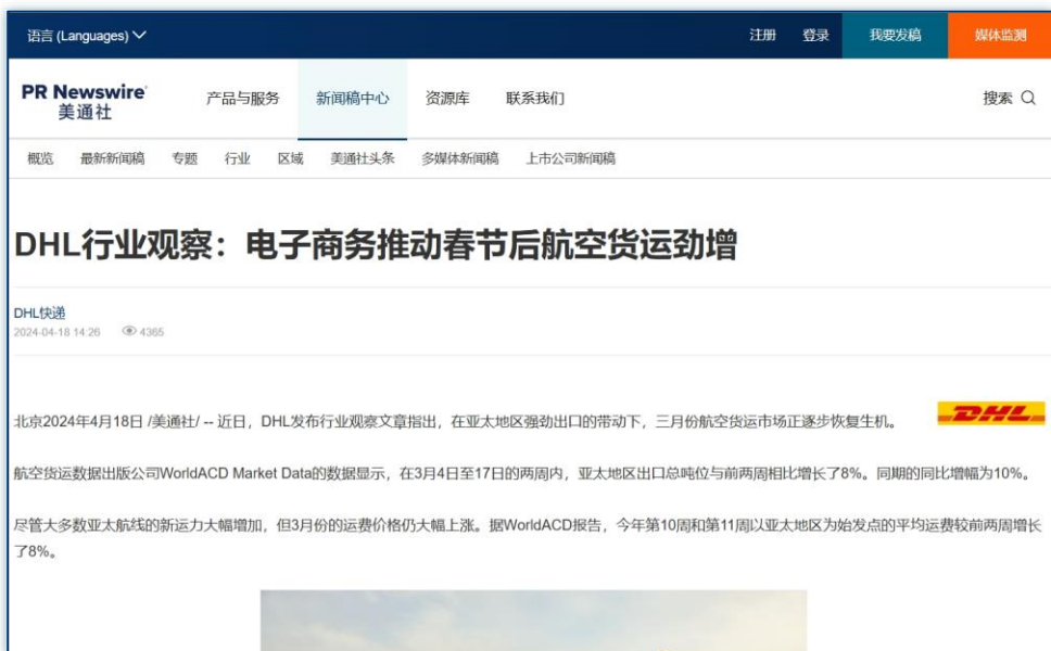
春节大数据 | 《DHL行业观察：电子商务推动春节后航空货运劲增》