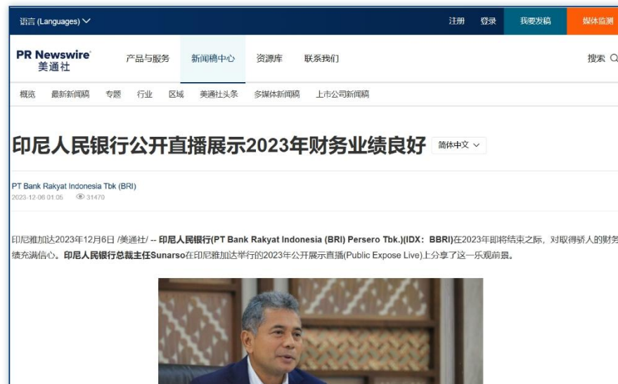
财务预测 | 《印尼人民银行公开直播展示2023年财务业绩良好》