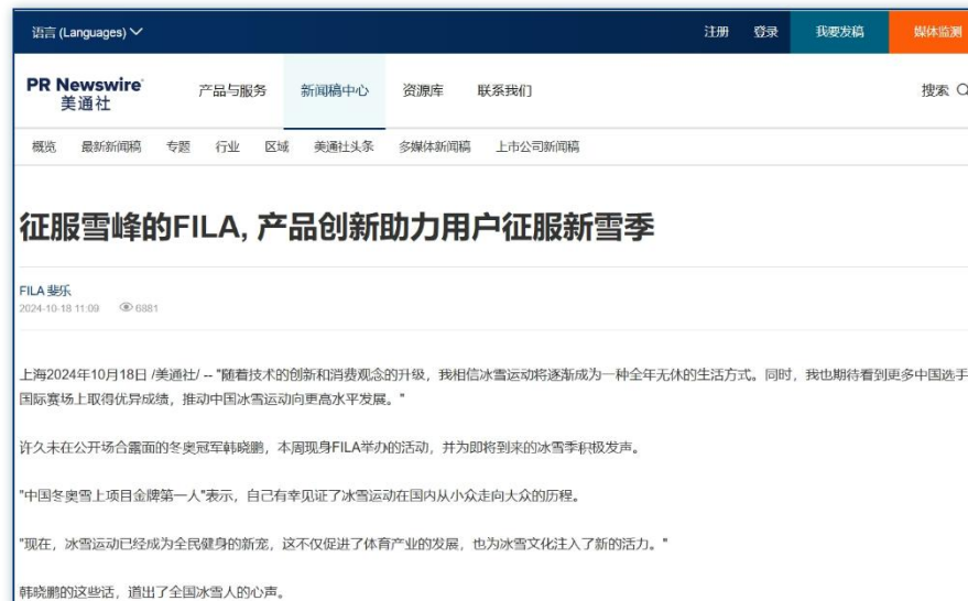
冰雪旅游 | 《征服雪峰的FILA，产品创新助力用户征服新雪季》