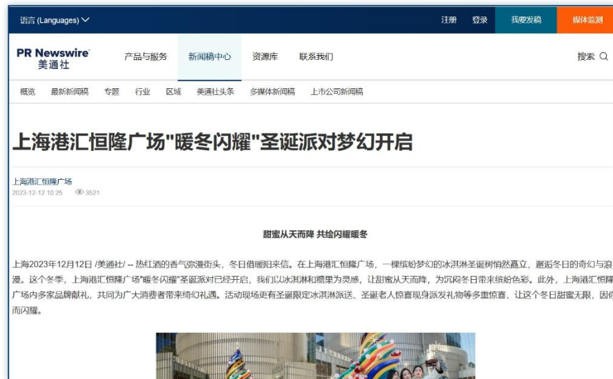
节日活动 | 《上海港汇恒隆广场“暖冬闪耀”圣诞派对梦幻开启》