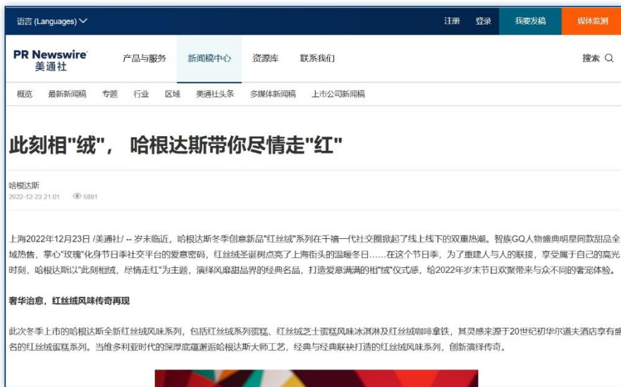
新品发布 | 《此刻相“绒”，哈根达斯带你尽情走“红”》