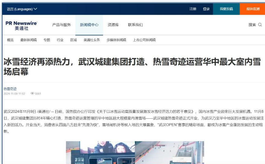
冰雪旅游 | 《冰雪经济再添热力，武汉城建集团打造、热雪奇迹运营华中最大室内雪场启幕》