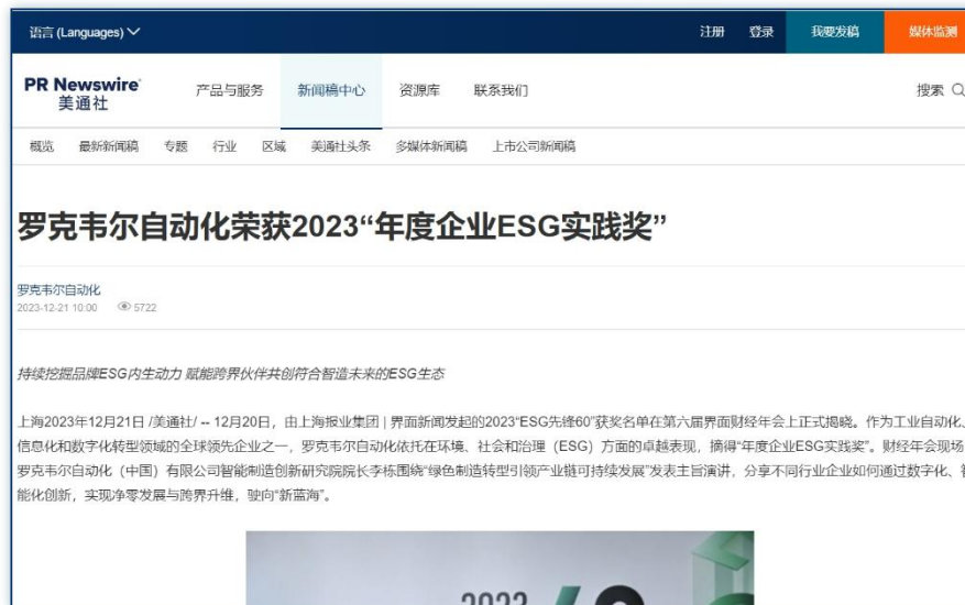
获奖/参会 | 《罗克韦尔自动化荣获2023“年度企业ESG实践奖”》