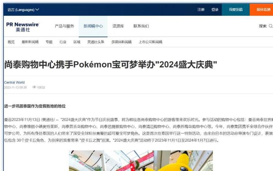
跨界联名 | 《尚泰购物中心携手Pokémon宝可梦举办“2024盛大庆典”》