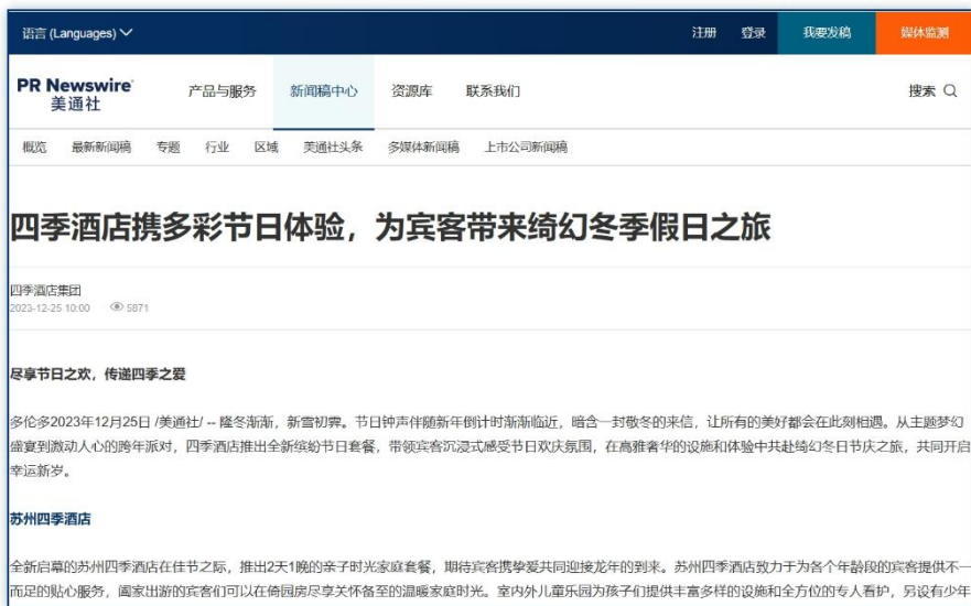
节日活动 | 《四季酒店携多彩节日体验，为宾客带来绮幻冬季假日之旅》