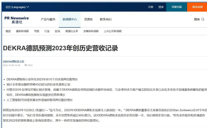
财务预测 | 《DEKRA德凯预测2023年创历史营收记录》