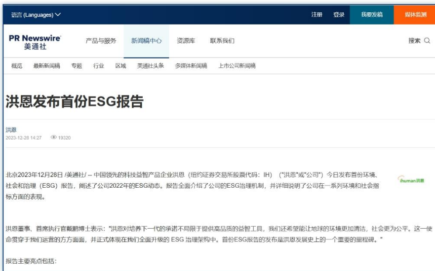
发布报告 | 《洪恩发布首份ESG报告》