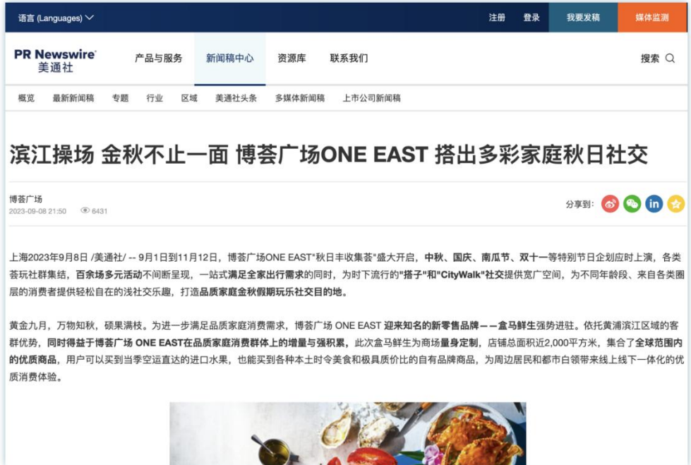
活动体验 | 《滨江操场 金秋不止一面 博荟广场ONE EAST 搭出多彩家庭秋日社交》