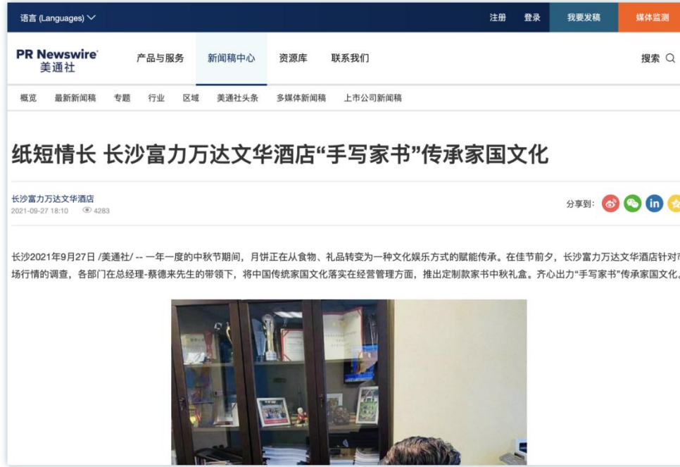
国风情怀 | 《纸短情长 长沙富力万达文华酒店“手写家书”传承家国文化》