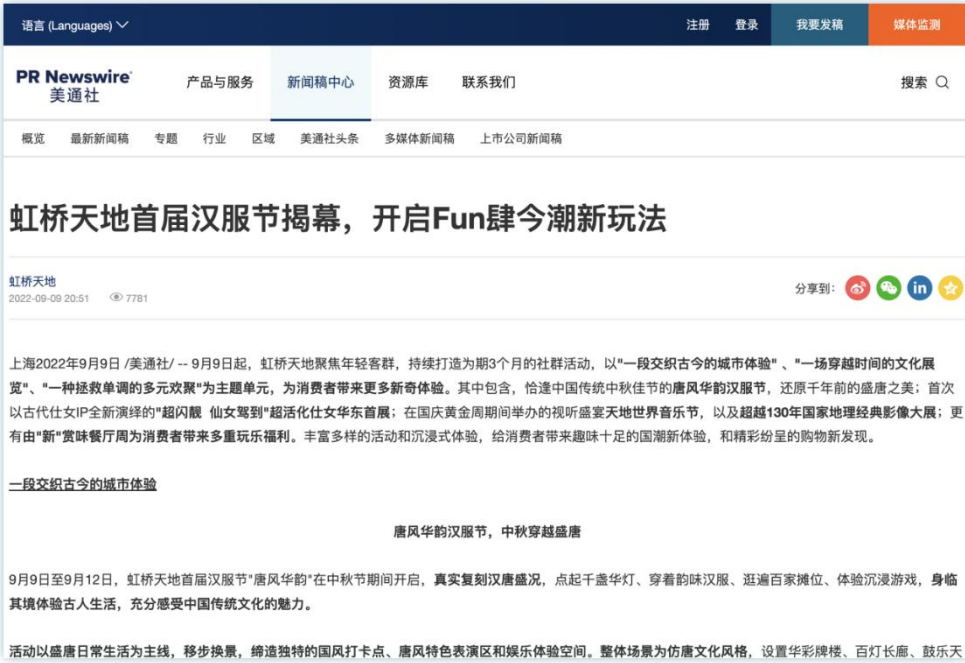
国风情怀 | 《虹桥天地首届汉服节揭幕，开启Fun肆今潮新玩法》