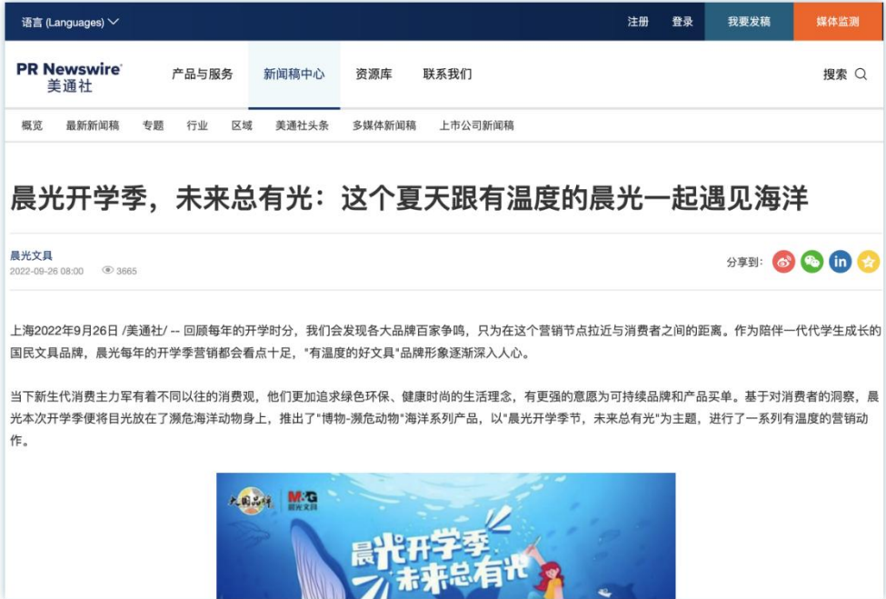
配套支持的新产品| 《晨光开学季，未来总有光：这个夏天跟有温度的晨光一起遇见海洋》