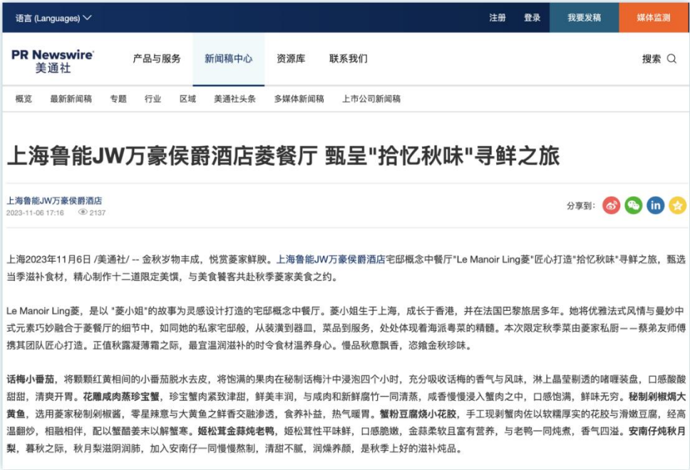
限定新品 | 《上海鲁能JW万豪侯爵酒店菱餐厅 甄呈“拾忆秋味”寻鲜之旅》