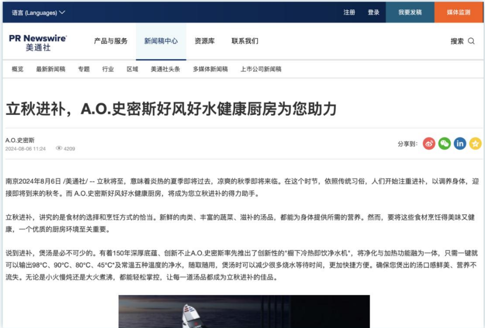
场景营销 | 《立秋进补，A.O.史密斯好风好水健康厨房为您助力》