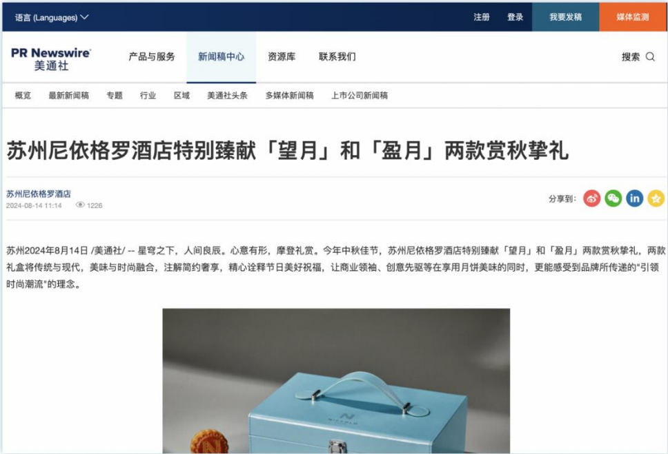
节日限定产品/活动 | 《苏州尼依格罗酒店特别臻献「望月」和「盈月」两款赏秋挚礼》