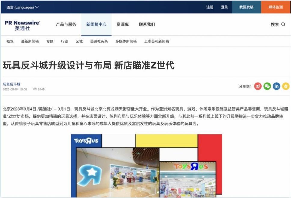
配套支持的新产品| 《玩具反斗城升级设计与布局 新店瞄准Z世代》