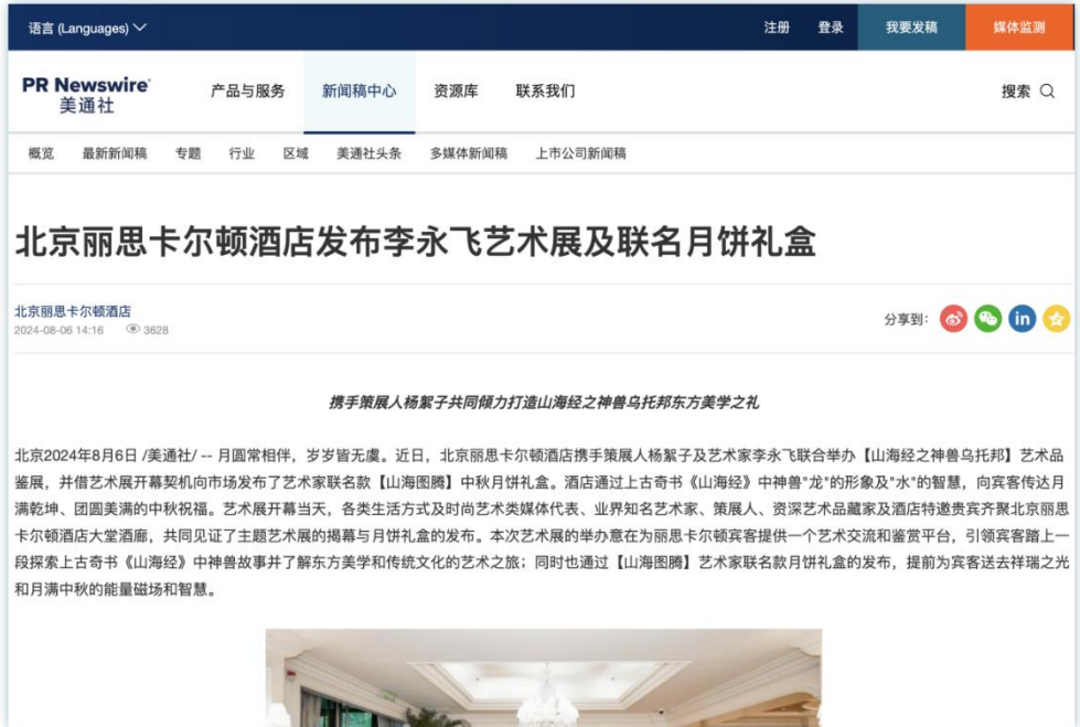
节日限定产品/活动 | 《北京丽思卡尔顿酒店发布李永飞艺术展及联名月饼礼盒》