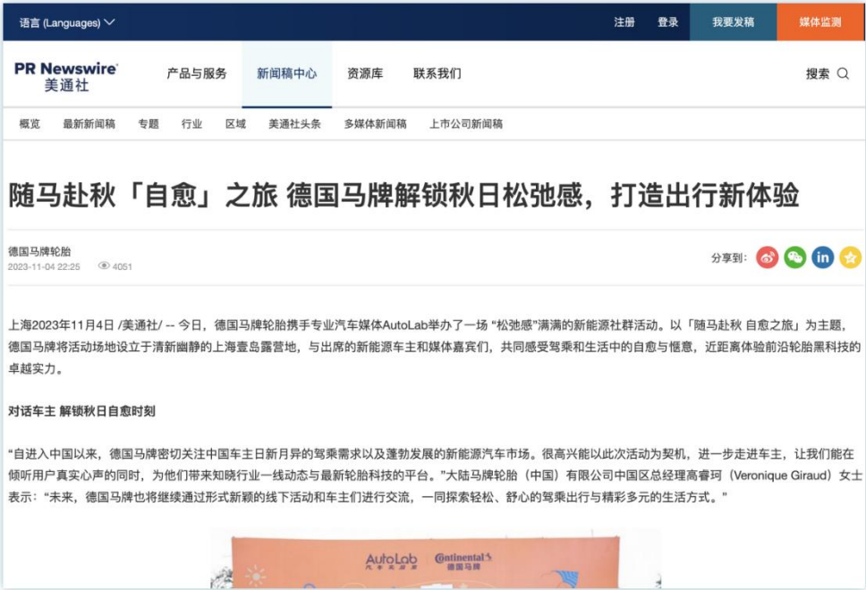
活动体验 | 《随马赴秋「自愈」之旅 德国马牌解锁秋日松弛感，打造出行新体验》