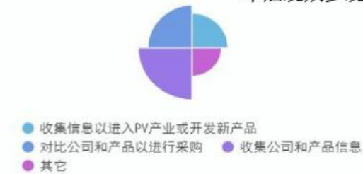
本届观众参观目的