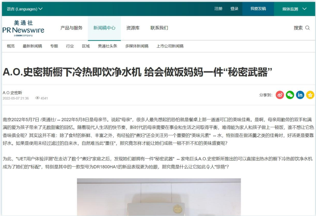
关爱产品 | 《A.O.史密斯橱下冷热即饮净水机 给会做饭妈妈一件“秘密武器”》