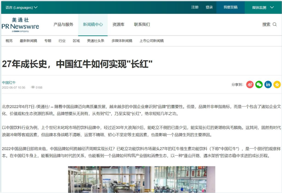
中国品牌的崛起与突围|《“27年成长史，中国红牛如何实现“长红”》