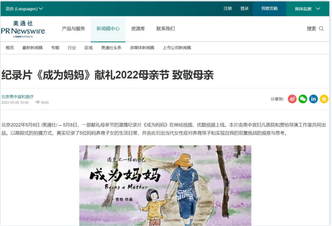
品牌价值观展现 | 《纪录片《成为妈妈》献礼2022母亲节 致敬母亲》