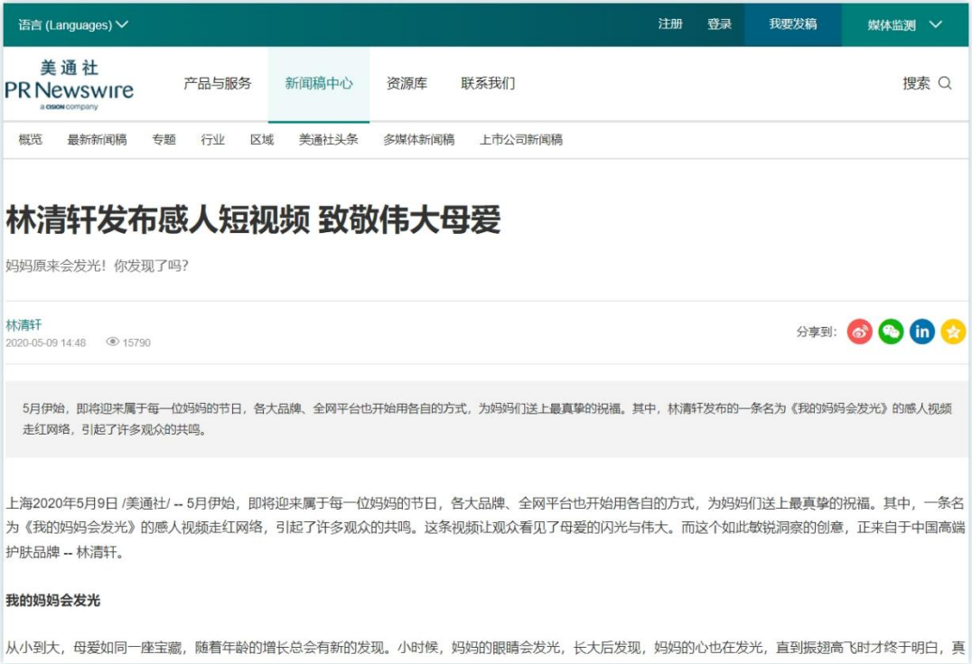
品牌价值观展现 | 《林清轩发布感人短视频 致敬伟大母爱》