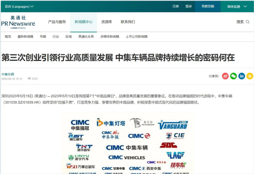
中国品牌的崛起与突围|《第三次创业引领行业高质量发展 中集车辆品牌持续增长的密码何在》