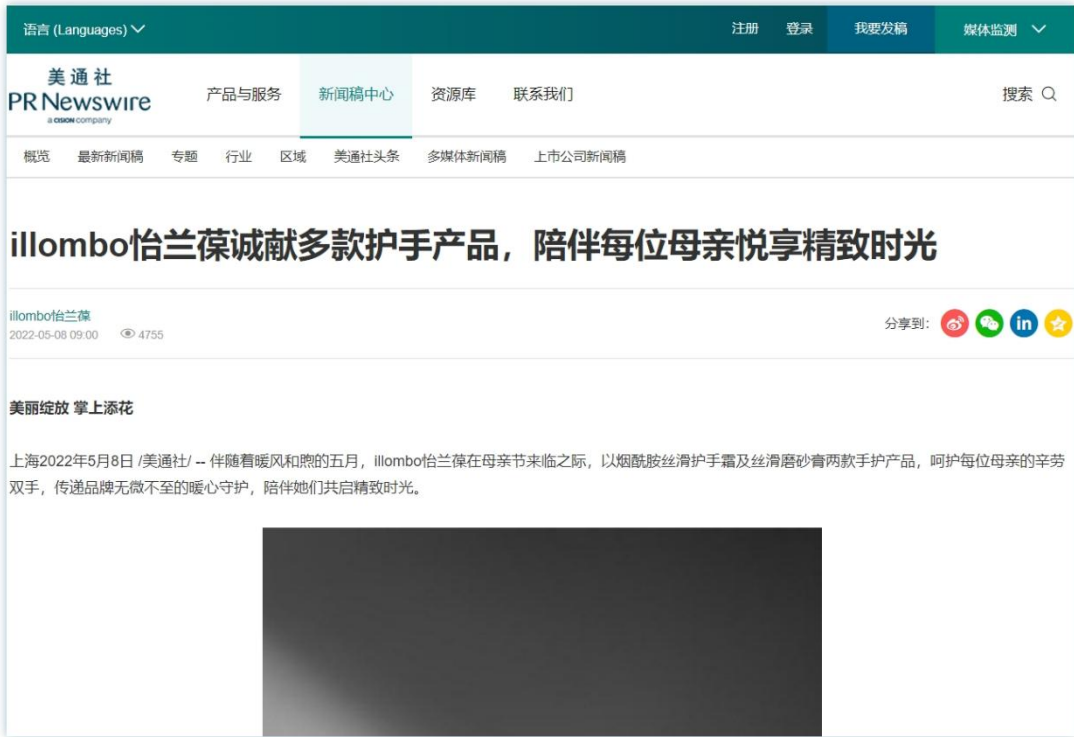
关爱产品 | 《illombo怡兰葆诚献多款护手产品，陪伴每位母亲悦享精致时光》