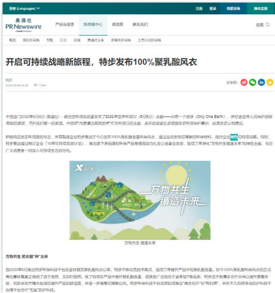
绿色品牌力 | 《开启可持续战略新征程，特步发布100%聚乳酸风衣》