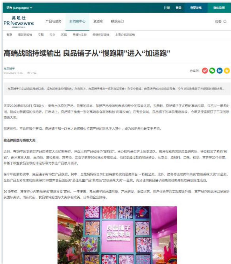
品牌战略 | 《高端战略持续输出 良品铺子从“慢跑期”进入“加速跑”》