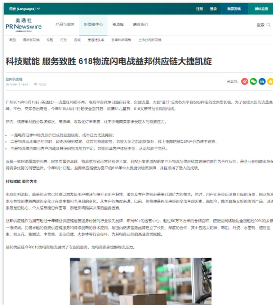
产业链 | 《科技赋能 服务致胜 618物流闪电战益邦供应链大捷凯旋》