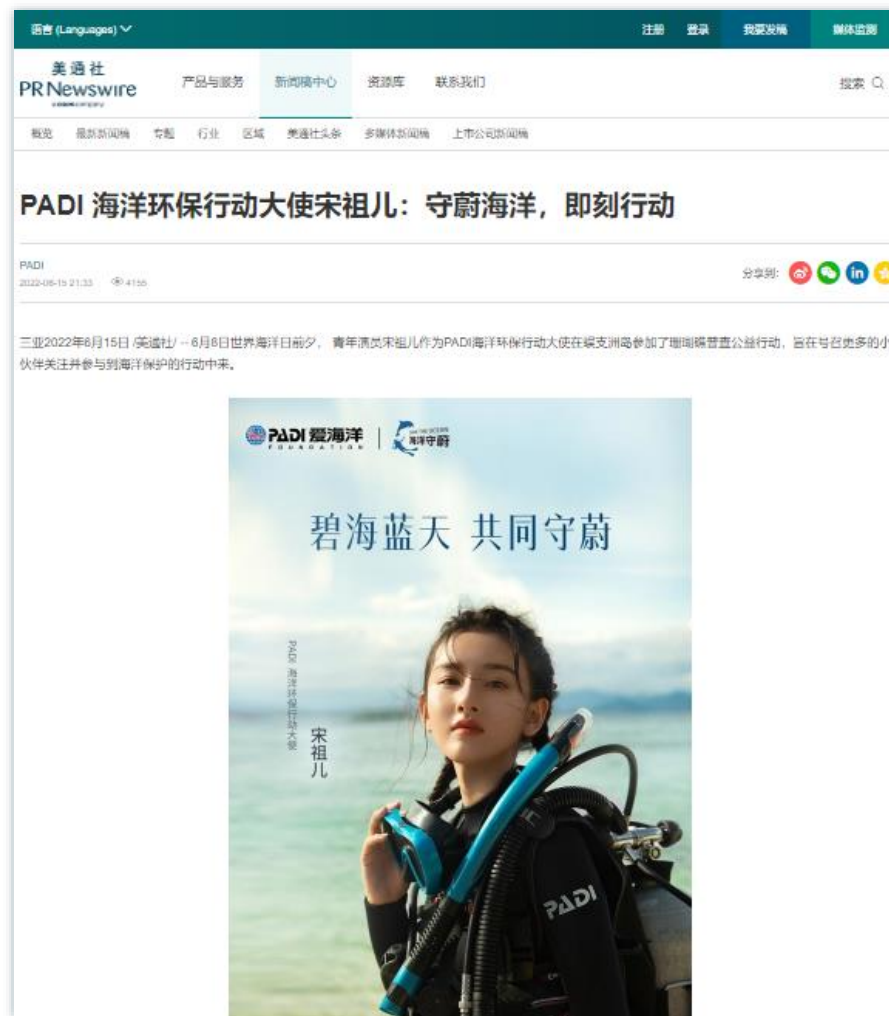
环保公益 | 《PADI 海洋环保行动大使宋祖儿：守蔚海洋，即刻行动》