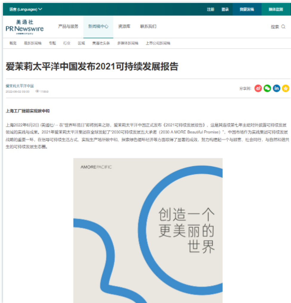
ESG绩效 | 《爱茉莉太平洋中国发布2021可持续发展报告》