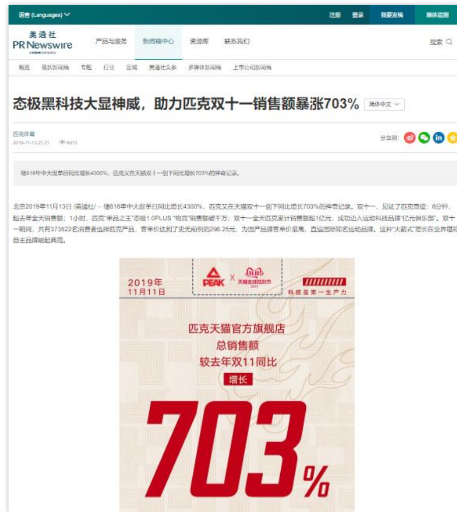
亮眼战绩 | 《态极黑科技大显神威,助力匹克双十一销售额暴涨703%》