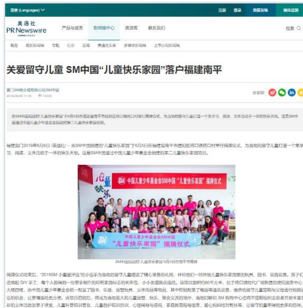
公益关爱 | 《关爱留守儿童 SM中国“儿童快乐家园”落户福建南平》