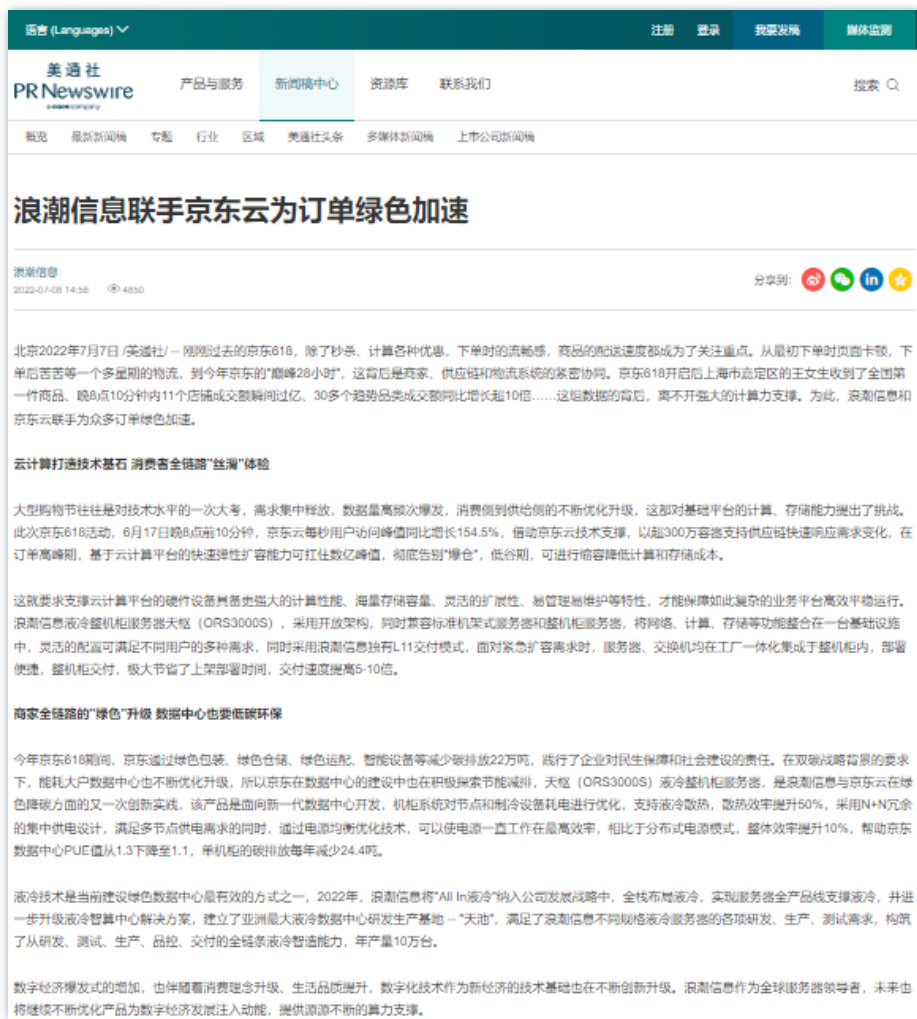
产业链 | 《浪潮信息联手京东云为订单绿色加速》