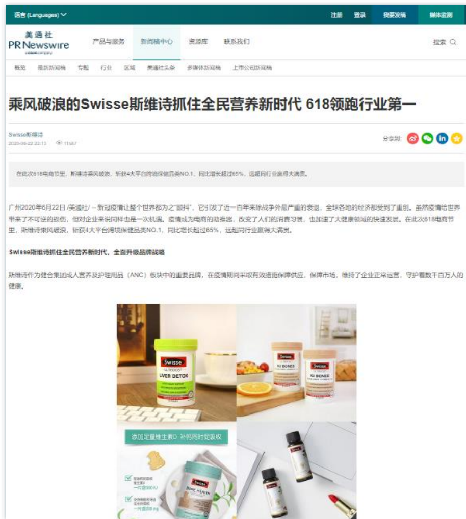
亮眼战绩 | 《乘风破浪的Swisse斯维诗抓住全民营养新时代 618领跑行业第一》