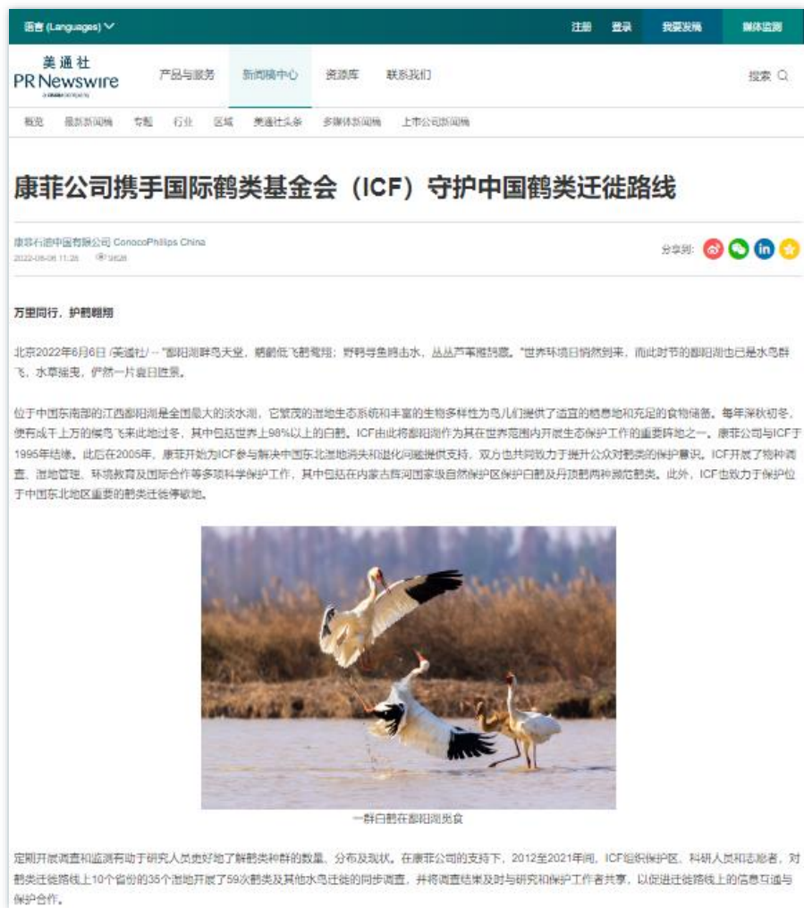
环保公益 | 《康菲公司携手国际鹤类基金会 (ICF) 守护中国鹤类迁徙路线》