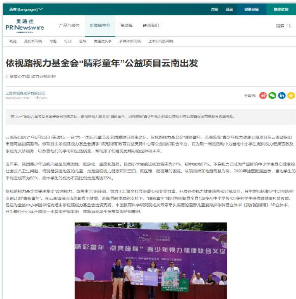
公益关爱 | 《依视路视力基金会“睛彩童年”公益项目云南出发》