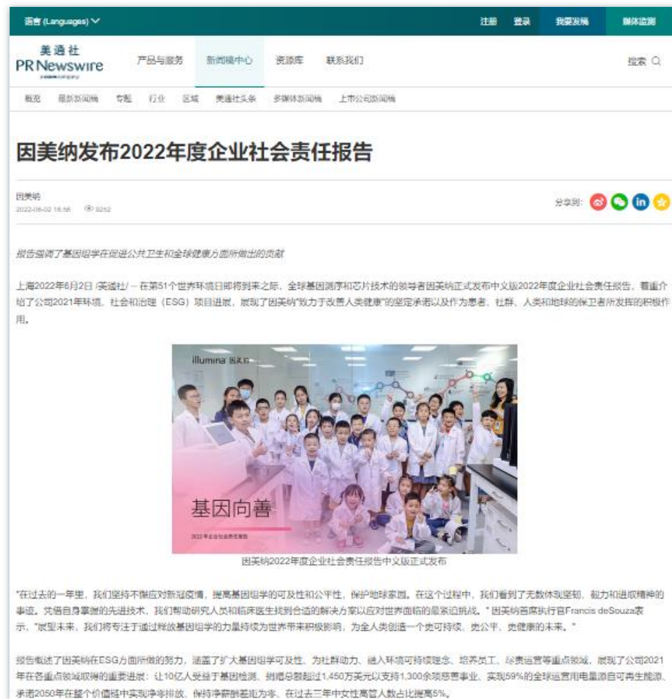
ESG绩效 | 《因美纳发布2022年度企业社会责任报告》