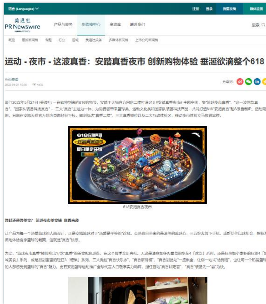
特色产品 | 《运动·夜市·这波真香：安踏真香夜市 创新购物体验 垂涎欲滴整个618》