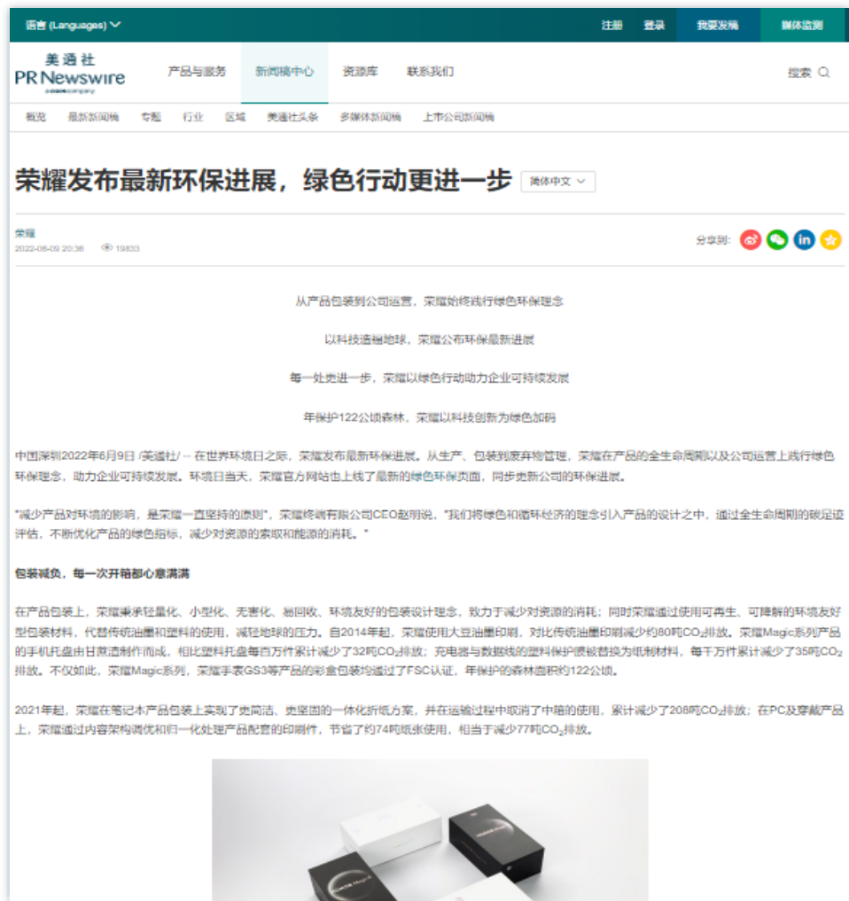
绿色品牌力 | 《荣耀发布最新环保进展，绿色行动更进一步》