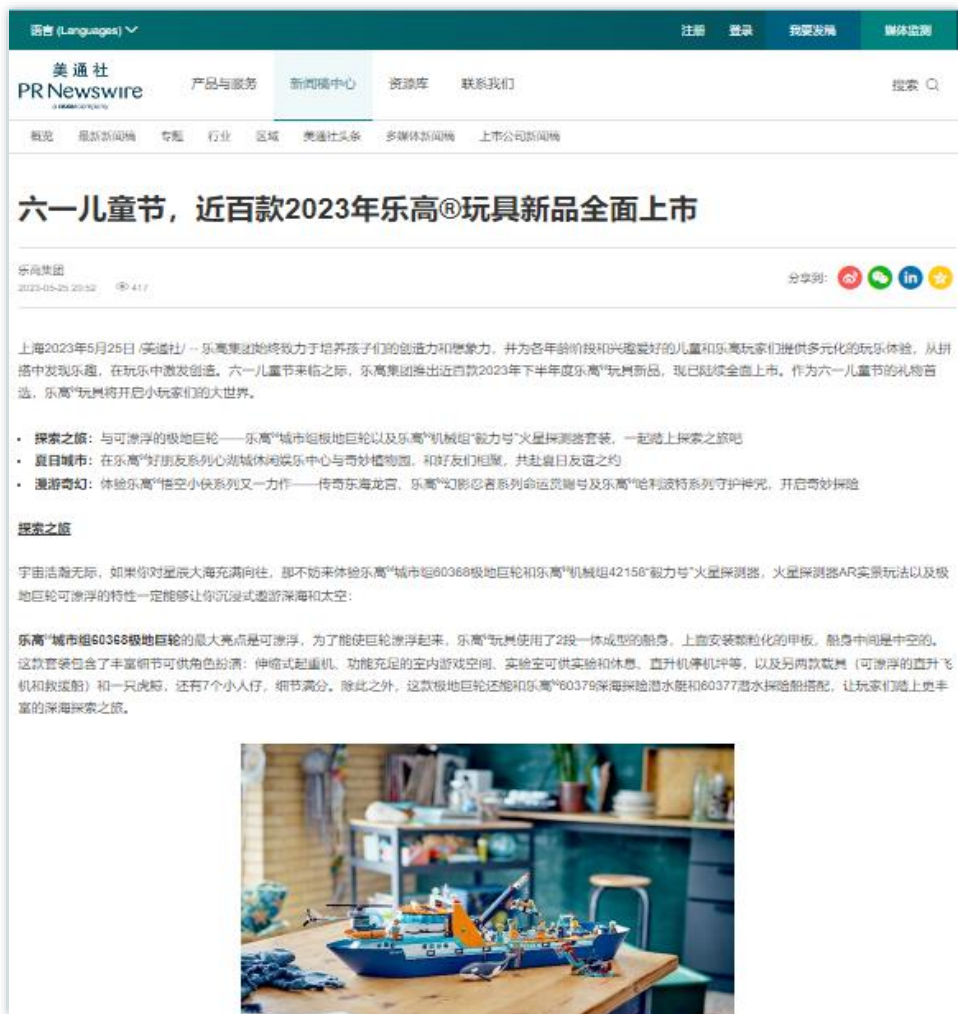
童趣上新 | 《六一儿童节, 近百款2023年乐高®玩具新品全面上市》