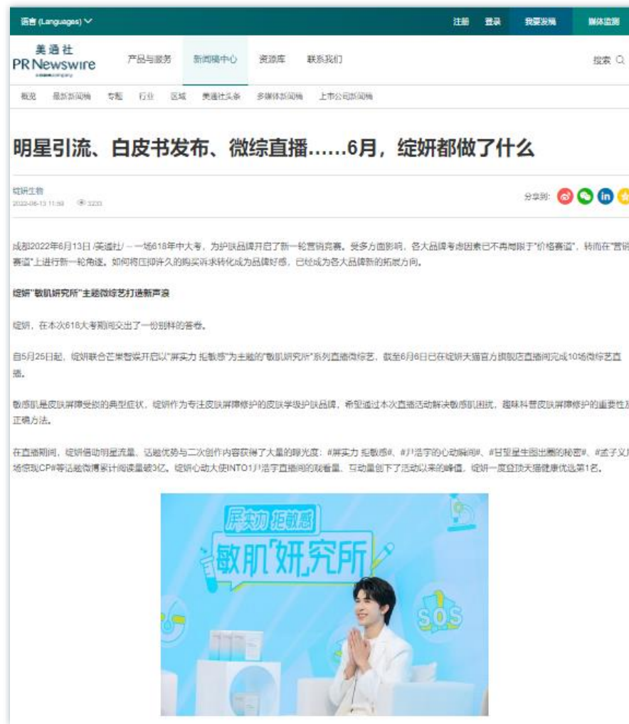
品牌战略 | 《明星引流、白皮书发布、微综直播.....6月, 绽妍都做了什么》