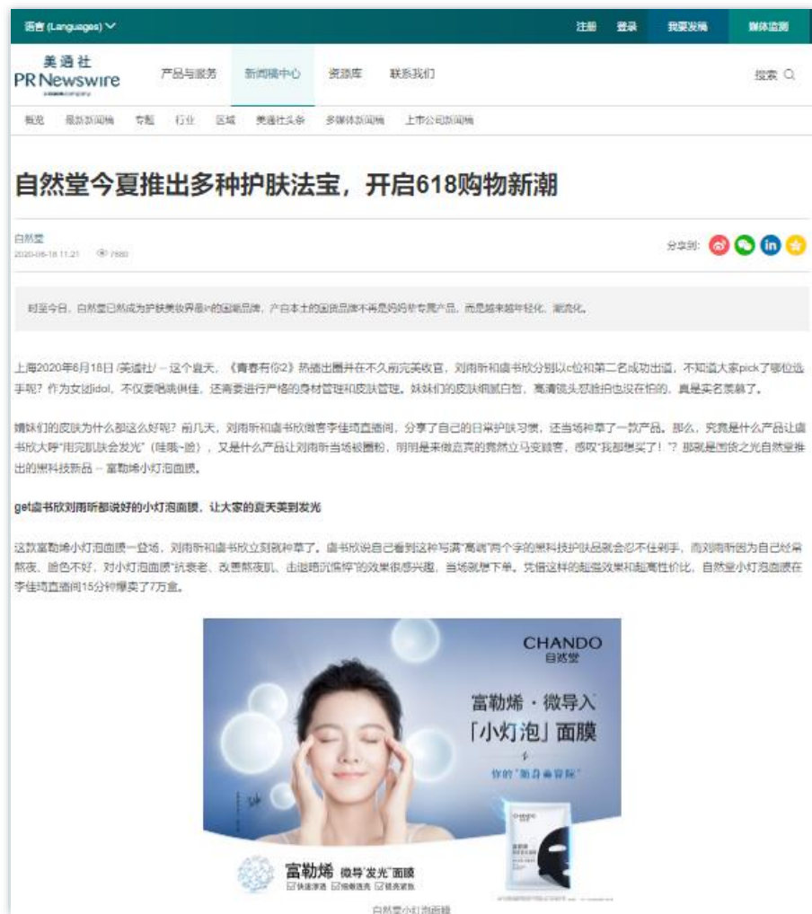
特色产品 | 《自然堂今夏推出多种护肤法宝，开启618购物新潮》